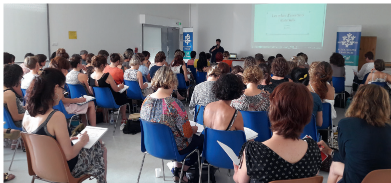
Réseau Ram - journée du 21 juin 2017 sur la posture des animatrices Ram et l'information de 1 er niveau délivrée auprès des familles et des professionnels - Caf Essonne ©

Prisma Conseil & Formation - Véra Ribault.